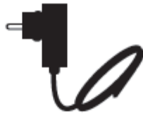
Outdoor-Ladegerät 220 V Part no. 6056