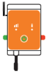
Luda.Fence Part no.1072