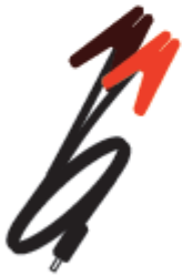
Outdoor-Ladegerät 12 V Part no. 6057