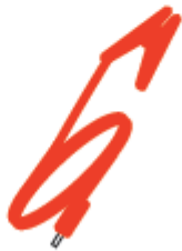
Rote Zaunklemme Part no. 6058