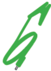
Grüne Erdungsk- lemme Part no. 6059